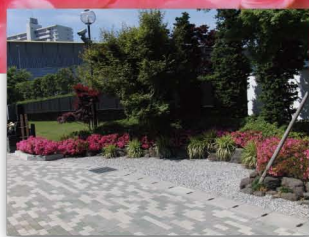
園内主参道脇和風庭

季節も初夏に移り朝夕ともさわやかな毎日です。今年は残念ながら空梅雨の様相で日中は真夏並みの暑さが続いております。熱中症対策をご準備ください。