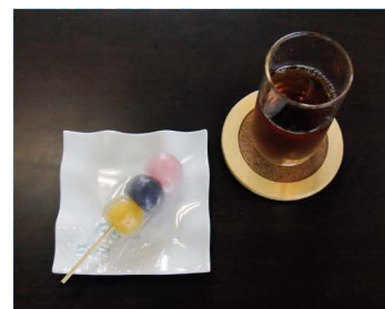
「柿次郎のフルーツ水団子」

“さん・もく・さん”と覚えてください。霊園の職員も参加してご歓談させていただきます。ご利用者様の法要や仏事の相談はもちろん、お友達への当園紹介のキッカケにもご活用頂ければ幸いです。